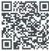
QR CODE ที่ ๑

- รับรองรายงานการประชุมขับเคลื่อนนโยบายของกรมปศุสัตว์ในพื้นที่จังหวัดอุบลราชธานี ครั้งที่ ๑/๒๕๖๖ เมื่อวันที่ ๒๓ มกราคม ๒๕๖๖ ณ ห้องประชุมสำนักงานปศุสัตว์จังหวัดอุบลราชธานี ตาม QR CODE ที่ ๑