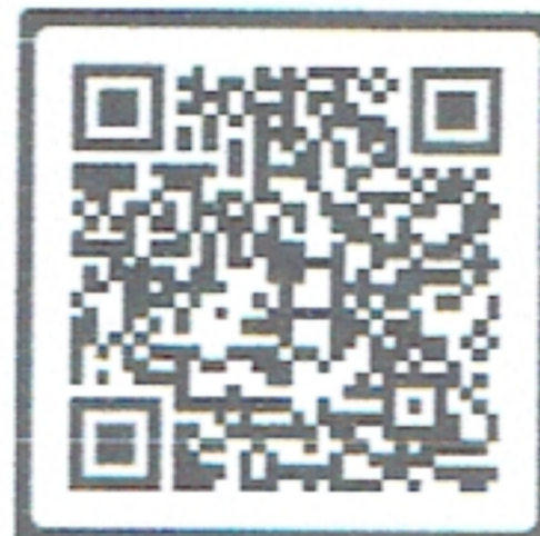
QR CODE ที่ ๑

ฝ่ายเลขานุการ การแต่งตั้งคณะกรรมการขับเคลื่อนนโยบายของกรมปศุสัตว์ เพื่อให้หน่วยงานของกรมปศุสัตว์ สังกัดบริหารราชการส่วนกลาง และหน่วยงานของกรมปศุสัตว์ สังกัดบริหารราชการส่วนภูมิภาค ที่มีภารกิจหน้าที่รับผิดชอบขับเคลื่อนนโยบายที่สำคัญของกรมปศุสัตว์ทั้งพื้นที่ส่วนกลางและส่วนภูมิภาคจังหวัดต่าง ๆ มีการประสานบูรณาการด้านอัตรากำลังและงบประมาณร่วมวางแผนและปฏิบัติงานตามภารกิจของกรมปศุสัตว์ และงานหรือโครงการด้านการปศุสัตว์ภายใต้ยุทธศาสตร์ของกรมปศุสัตว์ กลุ่มจังหวัดหรือจังหวัดให้สำเร็จตามวัตถุประสงค์ที่กำหนดไว้ หรือเพื่อขอรับการสนับสนุนงบประมาณดำเนินการ เพื่อให้บุคลากรของกรมปศุสัตว์ หน่วยงานสังกัดบริหารราชการส่วนภูมิภาคในจังหวัด และบุคลากรในหน่วยงานสังกัดบริหารราชการส่วนกลาง ที่มีภารกิจหน้าที่รับผิดชอบในพื้นที่จังหวัดนั้น ได้รับทราบ เรียนรู้ เข้าใจบทบาทหน้าที่ความรับผิดชอบของโครงการต่าง ๆ ภายใต้ภารกิจของกรมปศุสัตว์ ในพื้นที่จังหวัด อันเป็นการเตรียมความพร้อมของบุคลากรสำหรับก้าวขึ้นสู่ตำแหน่งที่สูงขึ้นต่อไป รายละเอียดอำนาจหน้าที่ตาม QR CODE ที่ ๑