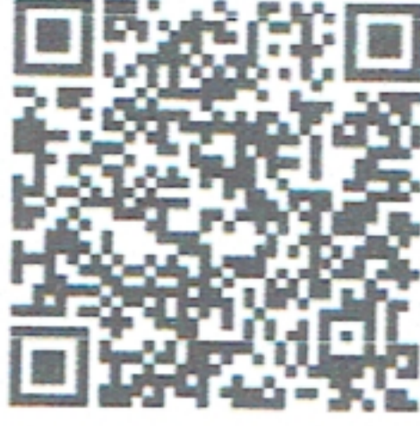
QR CODE ที่ ๒

ฝ่ายเลขานุการ เพื่อให้เกิดความสำเร็จตามวัตถุประสงค์ของกรอบคำสั่งกรมปศุสัตว์ จึงได้จัดทำคำสั่งสำนักงานปศุสัตว์จังหวัดอุบลราชธานีดังกล่าว รายละเอียดอำนาจหน้าที่ตาม QR CODE ที่ ๒