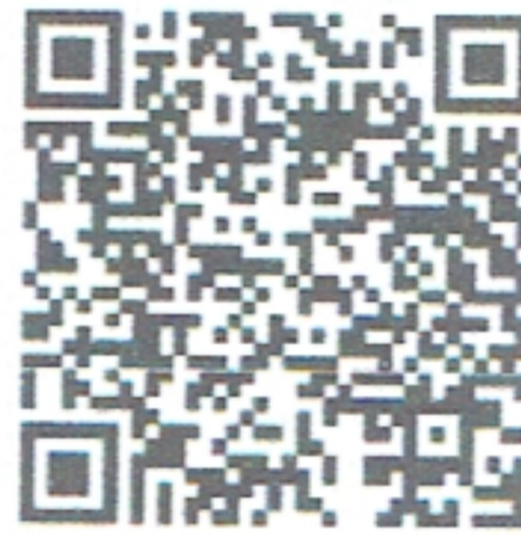
QR CODE ที่ ๓

ฝ่ายเลขานุการ รายละเอียดตาม QR CODE ที่ ๓