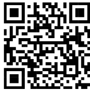
QR CODE ที่ ๑

- รับรองรายงานการประชุมขับเคลื่อนนโยบายของกรมปศุสัตว์ในพื้นที่จังหวัดอุบลราชธานี ครั้งที่ ๗/๒๕๖๖ เมื่อวันที่ ๒๗ กรกฎาคม ๒๕๖๖ ณ ห้องประชุมสำนักงานปศุสัตว์จังหวัดอุบลราชธานี ตาม QR CODE ที่ ๑