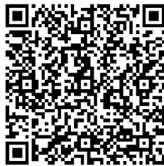
QR CODE ที่ ๑

- รับรองรายงานการประชุมขับเคลื่อนนโยบายของกรมปศุสัตว์ในพื้นที่จังหวัดอุบลราชธานี ครั้งที่ ๖/๒๕๖๖ เมื่อวันที่ ๒๘ มิถุนายน ๒๕๖๖ ณ ห้องประชุมสำนักงานปศุสัตว์จังหวัดอุบลราชธานี ตาม QR CODE ที่ ๑